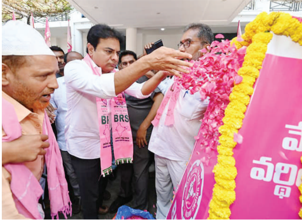
అలయం, సైకలీయిటీ, అంబేద్కర్ విగ్రహం, కమాండ్ కంట్రోల్ సెంటర్ వంటి వాటిని కూర్చోయాలని కేటీఆర్ తెలిపారు. వీటన్నింటికీ మించి తెలంగాణలో కేసీఆర్ ఆనవాళ్లు లేకుండా చేయాలంటే తెలంగాణనే లేకుండా చేయాలి. ఎందుకంటే తెలంగాణ అంటేనే గుర్తుచేసేది కేసీఆర్. ఇక తుదకు మళ్లీ తన పాత బాసో