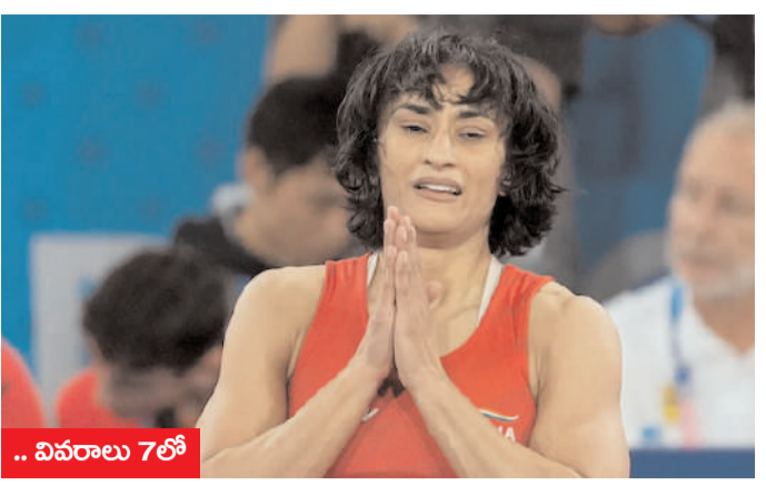
.. వివరాలు 7లో

వినోద్ పిటిషన్ పై తీర్పు మళ్లీ వాయిదా ఈనెల 16న నిర్ణయం