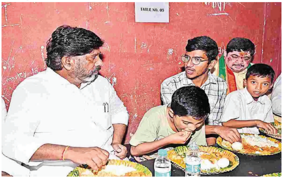
జగిత్యాల, ఆగస్టు 13 : మంగళవారం భట్టి జగిత్యాల జిల్లా మేట్పల్లి మండలం పెద్దాపూర్ గురుకుల పాఠశాలను సందర్శించారు. ఇటీవల మృతిచెందిన ఇద్దరు విద్యార్థుల తల్లిదండ్రులను కలిసి ఓదార్చారు. కరగతి గడులు, దార్మిటరీ, ఆపరణను పరిశీలించారు. పలువురు తల్లిదండ్రులు ఇచ్చిన వివరాలను స్వీకరించారు. విద్యార్థులతో సహాపత్రి భోజనం చేశారు. ఈ సందర్భంగా మీడియాతో మాట్లాడారు. పెద్దాపూర్ పాఠశాలకు చెందిన ఇద్దరు విద్యార్థులు మృతిచెందడం దిగ్భ్రాంతికి గురి చేసిందన్నారు. విదేశీ పర్యటనలో ఉన్న సీఎం రేచంట్ రెడ్డి ఆదేశాల మేరకు పెద్దాపూర్ పాఠశాలకు వచ్చానన్నారు. ఇక్కడ వెలలే ఒక రోజు మంత్రులు, ఎమ్మెల్యేలు మిగతా 2 లో

రాష్ట్రంలో గురుకుల పాఠశాలలు, కళాశాలలను ప్రకాశన చేస్తామని, అభివృద్ధికి నిధులు సమకూరుస్తామని ఉప ముఖ్యమంత్రి భట్టి విక్రమారావు తెలిపారు. 2004 నుంచి 2014 వరకు హాస్టళ్లలో చదివే విద్యార్థులకు హెల్త్ కార్డులు ఉండేవని, ప్రతి నెలా వైద్యులు వచ్చి వారి ఆరోగ్యాన్ని పరీక్షించి, కార్డులో రాసి వారని గుర్తుచేశారు. ప్రభుత్వ హాస్టళ్లలోనే పారా మెడికల్ సిబ్బంది ఉండేవారని, ఆ విధానాన్ని తిరిగి తీసుకొస్తామన్నారు. గురుకుల పాఠశాలలో చదివే ఏ విద్యార్థి నెలపై పడుకోవడానికి వీల్లేదని, మంచం, పరుపు, దున్నటిని ప్రభుత్వం సమకూరుస్తుందన్నారు.