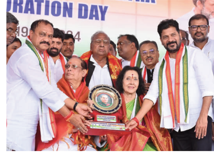
పోలీసులను ఆదేశిస్తున్నానని సీఎం రేపంట్ పేర్కొన్నారు. త్యాగం చరిత్ర గాంధీ కుటుంబాలది దోపిడీ చేసిన చరిత్ర కేసీఆర్ కుటుంబానిది హైద్రా ఆక్రమణదారుల్లో అంకుశంలా పనిచేస్తోంది రాజీవ్ సద్భావనా యాత్రలో సీఎం రేపంట్ నిష్ఠలు

హైదరాబాద్, అక్టోబర్ 19 : తెలంగాణను దోపిడీ చేసిన చరిత్ర కేసీఆర్ కుటుంబానిది కాగా, దేశం కోసం తమ ప్రాణాలు సైతం అర్పించిన ఘనత గాంధీ కుటుంబానిదని సీఎం రేపంట్ రెడ్డి అన్నారు. దేశం కోసం ఇందిరా గాంధీ, రాజీవ్ గాంధీ తమ ప్రాణాలు సైతం అర్పించారని.. అదే విధంగా సోనియా గాంధీ, రాహుల్ గాంధీ ప్రధాన మంత్రి పదవిని సైతం త్యాగం చేశారని రేపంట్ పేర్కొన్నారు. చార్మినార్ వద్ద ఏర్పాటు చేసిన 'జీవ్ గాంధీ సద్భావనా యాత్ర' సౌకర్య దినోత్సవ కార్యక్రమంలో సీఎం రేపంట్ రెడ్డి, మంత్రిలు, కాంగ్రెస్ ప్రజా ప్రతినిధులు పాల్గొన్నారు. మాజీ మంత్రి గీతారెడ్డికి రాజీవ్ గాంధీ సద్భావనా అవార్డును సీఎం రేపంట్ రెడ్డి ప్రధానం చేశారు. ఈ సందర్భంగా రేపంట్ రెడ్డి మాట్లాడుతూ.. దేశ సమగ్రత కోసం రాజీవ్ గాంధీ 34 ఏళ్ల క్రితం సద్భావన యాత్ర చేపట్టారు. ప్రతి ఏడాది అదే స్ఫూర్తిని కొనసాగిస్తూ వస్తున్నాం. సుదీర్ఘ కాలం ప్రజలకు సేవలు అందించిన మాజీ మంత్రి గీతారెడ్డిని సద్భావన అవార్డుకు ఎంపిక చేసినందుకు సంతోషంగా ఉంది. రాజకీయాల్లో ఉంటే పదవుల కోసం పాకులాడే వారిని చూశా కానీ గత ఎన్నికల్లో ఏమీ ఆశించకపోగా, పోటీ చేయని గొప్ప