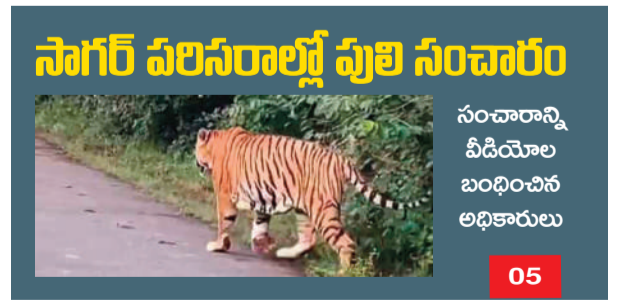
సంచారాన్ని వీడియోల బంధించిన అధికారులు 05

పూరిలో ఉన్న వ్యక్తుల భూములను స్వాధీనం చేసుకుంటామని పంట పాలాల మధ్య నోటీసులు