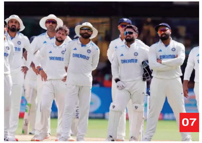
పుణె టెస్టుకు తుదిజట్టులో మార్పులు 07