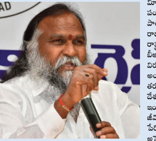
అయ్యారు. కేటీఆర్ రాజకీయం నేర్చుకోవాలంటే రేవంత్ రెడ్డి దగ్గరకి పోయి క్లాసిక్ తీసుకోవాలని అంటూ హితవుపలికారు. దామగుండం 360