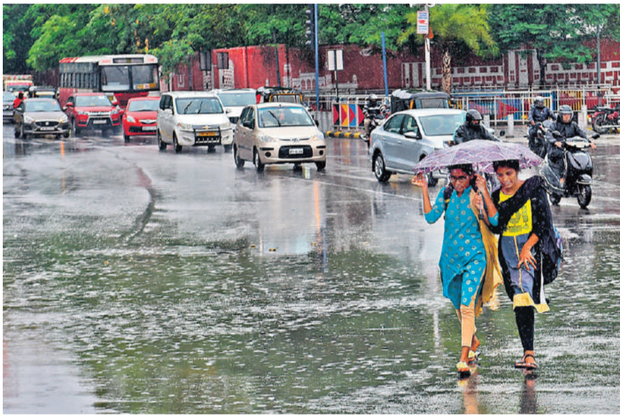
తీరం వైపు దూసుకొస్తున్న వాయుగుండం వంద కిలోమీటర్ల వేగంతో ఈదురుగాలులు ఉభయ తెలుగు రాష్ట్రాలకు భారీ వర్ష సూచన