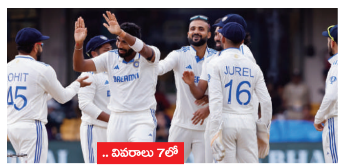
.. వివరాలు 7 లో

నేటి నుంచి భారత్, న్యూజిలాండ్ రెండో టెస్టు 'చిన్నస్వామి'కి భాస్కర్గా పుణె పిచ్.. స్పిన్తో తిప్పేసేందుకు ఇరు జట్లు సిద్ధం