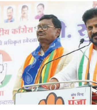
ప్రియాంక గాంధీ, కర్ణాటక సీఎం సిద్ధరామయ్య, తెలంగాణ సీఎం రేవంత్ రెడ్డి తదితరులు ప్రచారం

ఇక రేపు ఇక రెండోరోజు ఆదివారం ఉదయం నాగ్ పూర్ నుంచి నాందేడ్ చేరుకుంటారు. నయగావ్, భోకర్??, షోలాపూర్? నియోజకవర్గాల్లో ఎన్నికల ప్రచారంలో పాల్గొంటారు. ప్రచారం అనంతరం అక్కడి నుంచి మళ్లీ హైదరాబాద్ కు తిరిగి రానున్నట్లు తెలుస్తుంది. ఈ నెల 20న జరగనున్న మహారాష్ట్ర అసెంబ్లీ ఎన్నికల్లో అధికార మహాయతి, ప్రతిపక్ష మహా వికాస్ అభిమాని కూటమి మధ్య హూరాహూరి పోరు సాగుతోంది. ఈ నేపథ్యంలో అధికార ఎన్డీయే కూటమి, విపక్ష ఇండియా కూటమి గెలుపు కోసం శతవిధాలా ప్రయత్నిస్తున్నాయి. కాంగ్రెస్ తరపున ఆ పార్టీ జాతీయ అధ్యక్షుడు మల్లికార్జున్ ఖర్సే, అగ్రనేతలు రాహుల్ గాంధీ,