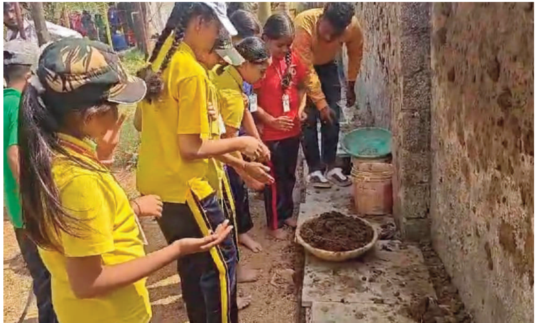
❖ ప్రకృతి వనరుల అద్భుతత, గ్రామీణ జీవన వైవిధ్యాన్ని అనుభవించడం.