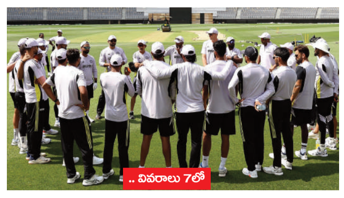
.. వివరాలు 7లో

అదానీ గ్రూపు మరో వివాదంలో ఇరుక్కుంది. అదికూడా లంచం కేసు కావడం విశేషం. భారత జాలియన్, అదానీ గ్రూప్ సంస్థ చైర్మన్ గౌతమ్ అదానీపై లంచం కేసు నమోదయ్యింది. ఈ మేరకు అమెరికాలో అభియోగాలు నమోదయ్యాయి. ఈ కంపెనీ అధికారులకు లంచాలు ఇవ్వజూపడమే గాక.. దాని గురించి ఇన్వెస్టిగేట్ తప్పుడు సమాచారం ఇచ్చి వారి నుంచి నిధుల సేకరణకు పాల్పడినట్లు న్యూయార్క్ ఫెడరల్ ప్రాసిక్యూటర్లు ఆరోపించారు. దీంతో గౌతమ్ అదానీ, ఆయన బంధువు సాగర్ అదానీ సహా మరో ఏడుగురిపై కేసులు నమోదు చేసినట్లు అధికారులు పేర్కొన్నారు.