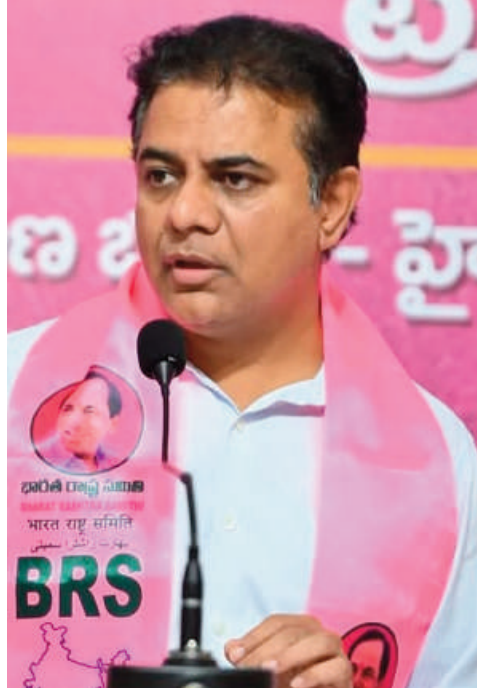
మిగతా 5 లో

హైదరాబాద్, రోమింగ్ స్ట్రాస్ : గతంలో కేసీఆర్ ఇచ్చిన నోటిఫికేషన్లను కాంగ్రెస్ ప్రభుత్వం పబ్లిసిటీ చేసుకుంటుందని బీఆర్ఎస్ చర్చింగ్ ప్రెసిడెంట్, మాజీ మంత్రి కేటీఆర్ అన్నారు. ఏడాది కాలంలో యువతకు లభించింది వికాసం కాదని విలాపమే అని అన్నారు. ఎన్నికల ముందు