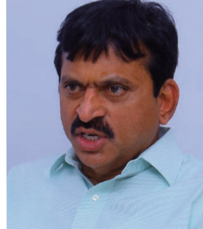
మిగతా 5 లో

హైదరాబాద్, రోమింగ్ స్ట్రాస్ : తెలంగాణలో ఇందిరమ్మ ఇళ్ల పథకం కోసం ప్రజలు ఎప్పుడెప్పుడూ అని ఎదురుచూస్తున్నారు. ఇల్లు లేని నిరుపేదల ఇందిరమ్మ పథకం ద్వారా ఇళ్ల నిర్మాణం కోసం ప్రభుత్వం ఇచ్చే ఐదు లక్షల రూపాయలు ఎప్పుడు ఇస్తుందని చాలా కాలంగా ఎదురు చూస్తున్నారు. ఇక ఇందిరమ్మ ఇళ్ల పథకం గురించి కనరత్తు చేస్తున్న ప్రభుత్వం కూడా త్వరితగతిన ఈ ప్రక్రియ ప్రారంభించడానికి శ్రీకారం చుట్టింది. లబ్ధిదారుల ఎంపిక డేట్ ఫిక్స్ ఇదే క్రమంలో తాజాగా ఇందిరమ్మ ఇళ్ల పథకానికి సంబంధించి తెలంగాణ గృహ నిర్మాణ శాఖ మంత్రి పొంగులేటి శ్రీనివాస్ రెడ్డి శుభవార్త చెప్పారు. ఇందిరమ్మ