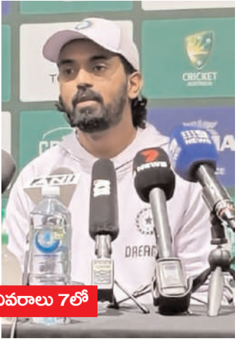
.. వివరాలు 7లో