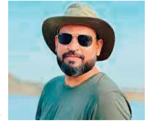
నూత్రప్రాయంగా ఒప్పందం కుదుర్చుకున్నట్లు నివేదికలు వెలువడినాయి. ఈ హైబ్రిడ్ మోడల్ ప్రకారం, రెండు దేశాలు తటస్థ వేదికపై తమ ఆటలను ఆడే అవకాశం ఉంటుంది.

భారత్ క్రికెట్ కంట్రోల్ బోర్డు (బీసీసీఐ) వచ్చే ఏడాది బీసీఐ ఫాంపియన్స్ ట్రోఫీ కోసం భారత్ జట్టును పాకిస్తాన్కు పంపకూడదన్న నిర్ణయానికి మాజీ ఆల్ రౌండర్ యూసుఫ్ పఠాన్ పూర్తి మద్దతు తెలిపారు. యూసుఫ్, భారత్ను 2011 ప్రపంచకప్, 2007 టీ20 ప్రపంచకప్ విజయాల్లో కీలక పాత్ర పోషించిన ఆటగాడు, ఈ నిర్ణయాన్ని సమర్థిస్తూ బీసీసీఐ ఆటగాళ్ల భద్రతను ఎల్లప్పుడూ మొదటి ప్రాధాన్యంగా చూసుకుంటుందని కొనియాడాడు. "బీసీసీఐ ఎల్లప్పుడూ ఆటగాళ్ల భద్రతను, దేశ ప్రయోజనాలను దృష్టిలో ఉంచుకుంటుంది. కాబట్టి బోర్డు తీసుకున్న ఏ నిర్ణయం అయినా ఈ రెండు అంశాలకే అనుగుణంగా ఉంటుంది." అని యూసుఫ్ అన్నారు. ఇదిలా ఉండగా, పాకిస్తాన్ క్రికెట్ బోర్డు (పీసీబీ) మొత్తం టోర్నమెంట్ను పాకిస్తాన్లో నిర్వహించాలన్న దృఢావేశంతో ఉన్నది. కానీ తాజా పరిణామాలు ఈ నిర్ణయంపై కొంత మార్పు తెచ్చే అవకాశాలు చూపుతున్నాయి. అంతర్జాతీయ క్రికెట్ కౌన్సిల్ , పీసీబీ 2027 వరకు జరిగే టోర్నమెంట్లలో హైబ్రిడ్ మోడల్ను అనుసరించేందుకు