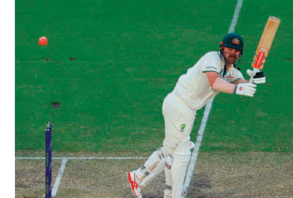
చరిత్రలోనే అత్యధిక సెంచరీలు బాదిన రెండో ఆసీస్ బ్యాటర్ గా ట్రావిస్ హెడ్ రికార్డ్ సాధించాడు.

చరిత్ర సృష్టించిన ట్రావిస్ హెడ్ ఆస్ట్రేలియా స్టార్ బ్యాటర్ ట్రావిస్ హెడ్ చరిత్ర సృష్టించాడు. డే/నైట్ టెస్ట్ చరిత్రలోనే అత్యంత వేగంగా శతకం బాదిన బ్యాటర్ గా నిలిచాడు. ఐదు టెస్ట్ల బోర్డర్ గవాస్కర్ ట్రోఫీలో భాగంగా టీమిండియాతో అడిలైడ్ వేదికగా జరుగుతున్న పింక్ బాల్ మ్యాచ్లో ట్రావిస్ హెడ్ 111 బంతుల్లో సెంచరీ పూర్తి చేసుకొని ఈ ఫీట్ సాధించాడు. ఈ క్రమంలో తన పేరిట ఉన్న రికార్డును తనే తిరిగ రానాడు. 2022లో ఇంగ్లండ్తో హౌబర్ట్ వేదికగా జరిగిన పింక్ బాల్ మ్యాచ్లో 112 బంతుల్లో శతకం సాధించాడు. పింక్ బాల్ టెస్టులో అత్యంత వేగంగా శతకం బాదిన టాప్-3 బ్యాటర్లలో ట్రావిస్ హెడ్ ఉన్నాడు. వెస్టిండీస్లో ఓవర్ వేదికగా జరిగిన మ్యాచ్లో 125 బంతుల్లో ట్రావిస్ హెడ్ శతకం సాధించాడు. పింక్ బాల్ టెస్ట్