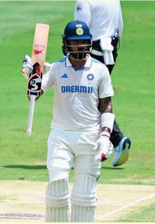
ఆస్ట్రేలియా రెండో ఇన్నింగ్స్ ఆడాల్సింది. చివరి రోజు ఇండియన్ టీమ్ చివరి వికెట్ ను త్వరగా తీసి.. ఆ తర్వాత రెండో ఇన్నింగ్స్ లో వేగంగా పరుగులు చేసి రోహిత్ సేనకు కంగారూలు సవాలు విసురుతారా. లేక మ్యాచ్ డ్రా కోసమే ఆడతారా అన్నది చూడాలి. చివరి రోజు వర్షం ఆటంకం కలిగించకపోతే మాత్రం ఈ మ్యాచ్ లో ఫలితం కోసం ఆస్ట్రేలియా కచ్చితంగా ప్రయత్నిస్తుందనడంలో సందేహం లేదు.

చేసిన పోరాటం అసామాన్యం అని చెప్పొచ్చు. వర్షం వల్ల తరచూ అంతరాయాలు కలుగుతున్న ఈ టెస్టులో టీమిండియాను కచ్చితంగా ఫాలో ఆన్ ఆడిస్ట్ గెలవచ్చని ఆస్ట్రేలియా భావించింది. కానీ బుర్రా, ఆకాష్ దీప్ జోడి ఆ అవకాశం ఇవ్వలేదు. ఊహకందని రీతిలో ఆసీస్ బౌలర్లను సమర్థంగా ఎదుర్కొన్న ఈ ఇద్దరూ చివరి వికెట్ కు ఇప్పటికే 39 పరుగులు జోడించారు. ఇందులో ఆకాష్ దీప్ చేసిన పరుగులే 27 కావడం విశేషం. అందులో రెండు ఫోర్లు, ఒక సిక్స్ ఉన్నాయి. బుర్రా కూడా 10 పరుగులతో అజేయంగా ఉన్నాడు. వీళ్లిద్దరూ వికెట్ కాపాడుకోవడంతో ఫాలో ఆన్ గండం గట్టెక్కిడానికి కావాల్సిన 246 పరుగుల మార్క్ ను టీమిండియా అందుకుంది. ఆ సార్లు దాటగానే ఆకాష్ దీప్ ఓ భారీ సిక్స్ కూడా కొట్టాడు. ఆ సమయంలో వెలుతురు సరిగా లేదంటూ ఆటను నిలిపేశారు. దీంతో నాలుగో రోజు ముగిసే సమయానికి ఇండియన్ టీమ్ తొలి ఇన్నింగ్స్ లో 9 వికెట్లకు 252 రన్స్ చేసింది. ఇంకా 193 పరుగులు వెనుకబడి ఉంది. బ్రెస్టన్ టెస్ట్ ఇక డ్రా అవడం ఖాయంగా కనిపిస్తోంది. ఇప్పటికే ఈ టెస్టు తొలి రోజు ఆట 90 శాతానికిపైగా తుడిచిపెట్టుకుపోయింది. తర్వాతి మూడు రోజులు కూడా వరుణుడు తరుచూ అడ్డుపడుతూనే ఉన్నాడు. దీంతో నాలుగు రోజులు కలిపి కేవలం 191 ఓవర్లు మాత్రమే సాధ్యమయ్యాయి. చివరి రోజు కూడా వర్షం పడే అవకాశాలు ఉన్నాయి. దీనికోసం టీమిండియా ఫాలో ఆన్ తప్పించుకోవడంతో