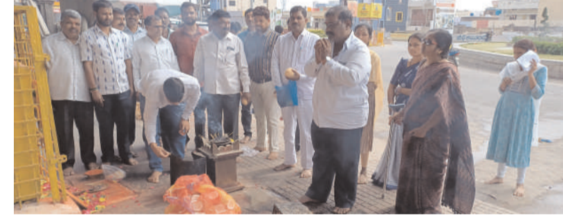
యాదగిరిగుట్ట, రోమింగ్ స్టోర్స్: