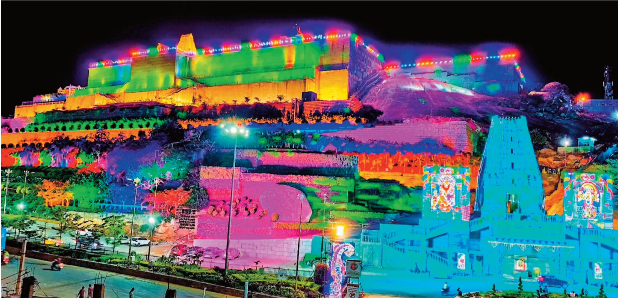
స్పెషల్ లైటింగ్ తో వెలిగిపోతున్న యాదగిరిగుట్ట