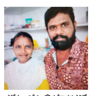
పోలీసులు విడిదల చేసిన కిడ్నాప్ ఫోటో