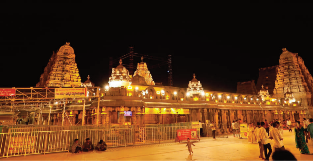
విద్యుత్ దీపాల వెలుగులో గుట్టకు వెలుగుల జలుగులు