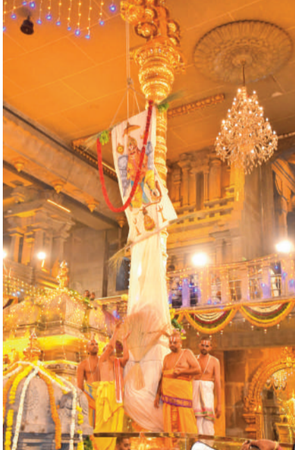
గుట్ట బ్రహ్మాత్మవాలలో ఆదివారం ధ్వజారోహణం నిర్వహిస్తున్న అర్చకులు...