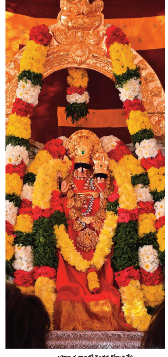
బ్రహ్మాత్మవాలలో రెండవ రోజు విశేష పుష్కలంకరణలో శ్రీ లక్ష్మీనరసింహస్వామి వారు.