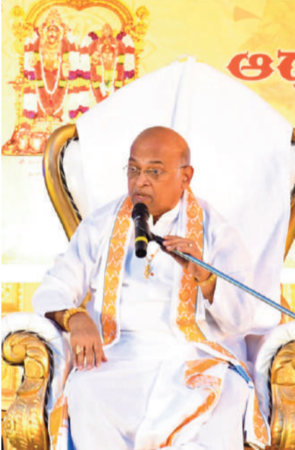
శ్రీలక్ష్మీనరసింహ వైభవం గురించి ఆధ్యాత్మిక ప్రవచనం చేస్తున్న పద్మశ్రీ డాక్టర్ గరికపాటి నరసింహారావు.