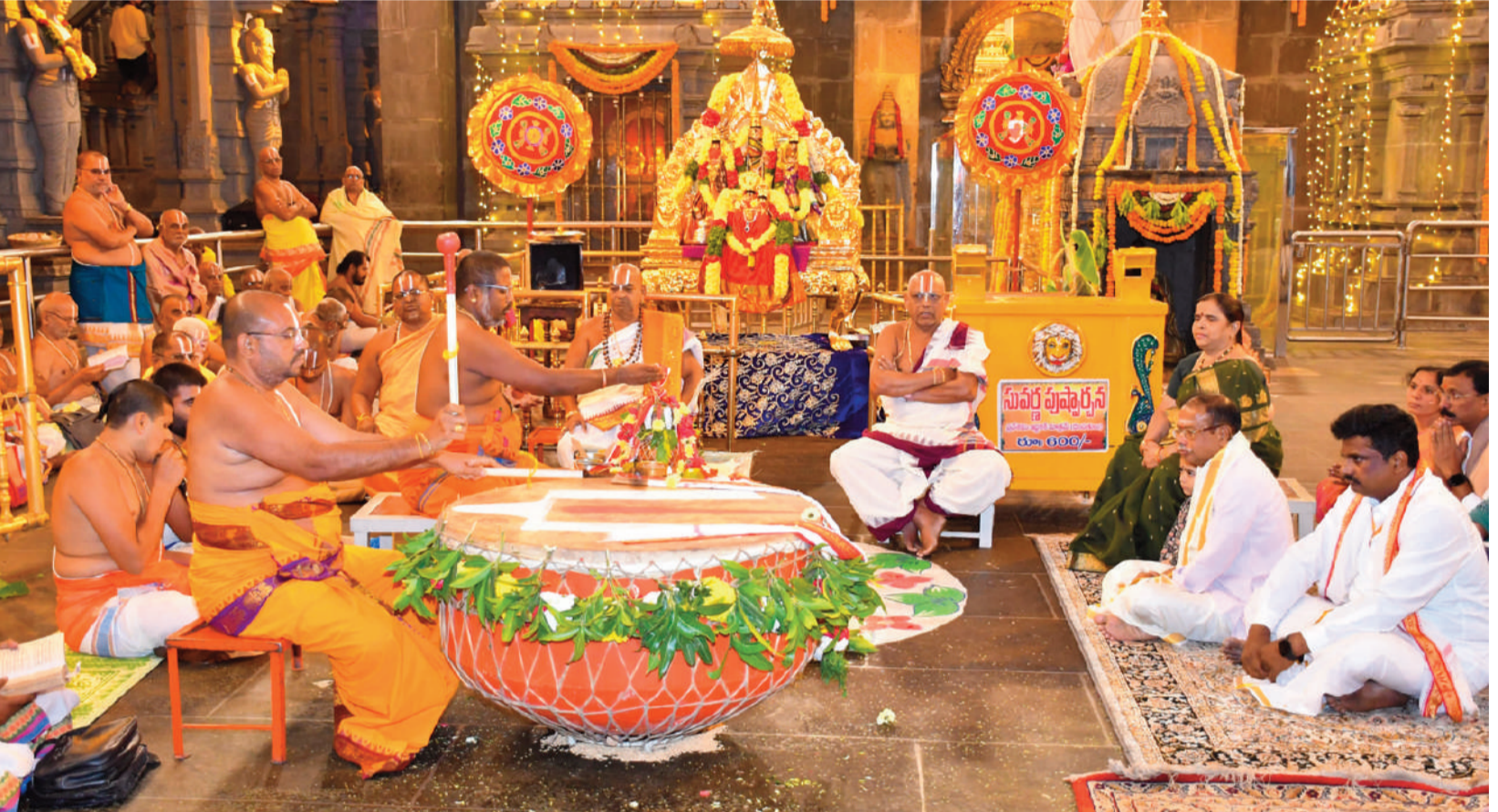
గుట్ట బ్రహ్మాత్మవాలలో ఆదివారం రాత్రి భేరి పూజ నిర్వహిస్తున్న అర్చకులు

బ్రహ్మాత్మవాల్లో భాగంగా ఆలయంలో మూడో రోజైన సోమవారం మత్స్యవతార అలంకార సేవ, శేషవాహన సేవ నిర్వహించనున్నారు. ఉదయం 9 గంటలకు స్వామివారిని మత్స్యవతారంలో అలంకరించి ఊరేగించనున్నారు. రాత్రి 8.30 గంటలకు శేషవాహనంపై స్వామివారు ప్రధానాలయ మాడవీధుల్లో విహరిస్తూ భక్తులకు దర్శనమిచ్చే ఉత్సవాలను ఘనంగా జరపనున్నారు.