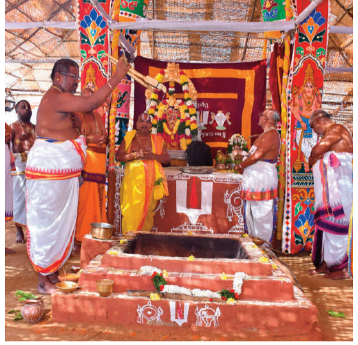
బ్రహ్మాత్మవాలలో హవనం నిర్వహిస్తున్న అర్చకులు