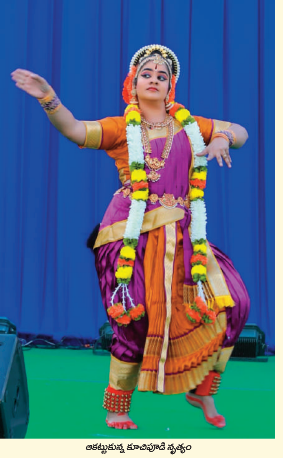
ఆకట్టుకున్న కూచిపూడి నృత్యం