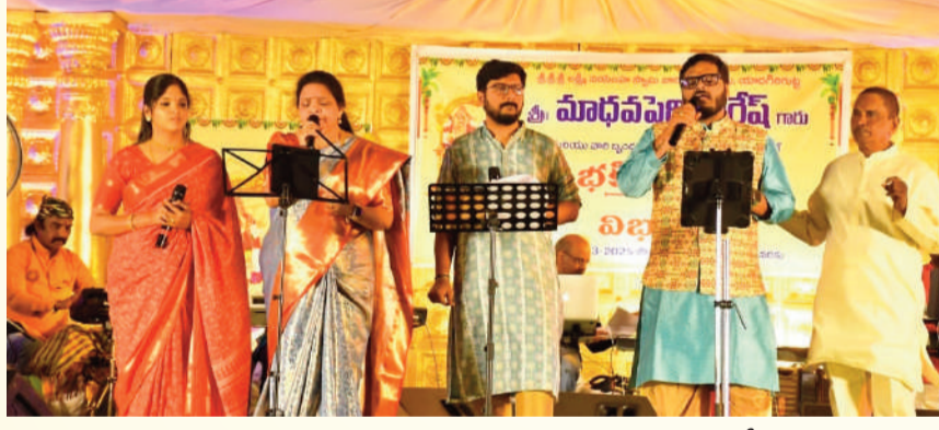
ఆకట్టుకున్న మాధవపెద్ది సత్యం బృందం వారు ఆలపించిన సంగీతరసాలు.