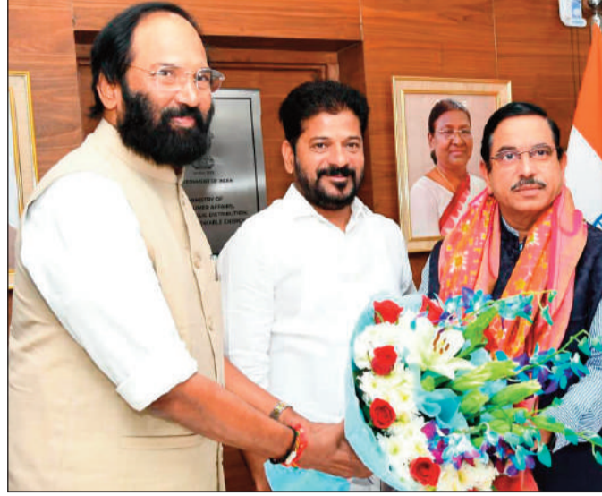
సమాచారం. ఈ క్రమంలోనే కోటా పెంచాలని సీఎం విజ్ఞప్తి చేసినట్లు తెలుస్తోంది.

దాదాపు అరగంట పాటు కొనసాగిన చర్చల్లో 2014-15 గాను సేకరించిన ధాన్యం బకాయిలు రూ.1,468.94 కోట్లు విడుదల చేయాలని కేంద్రమంత్రికి వినతిపత్రం అందజేశారు. ప్రధాన మంత్రి గరీబ్ కల్యాణ్ యోజన కింద సరఫరా చేసిన బియ్యం బకాయిలు రూ. 343.27 కోట్లు విడుదల చేయడంతోపాటు సీఎంఆర్ డెలివరీ గడువును పొడిగించాలని కోరారు. రాష్ట్రంలో గత పదేళ్లుగా కొత్త రేషన్ కార్డుల జారీ ప్రక్రియ జరగలేదు. ఈ క్రమంలోనే కార్డుల జారీకి రేవంత్ సర్కార్ కనరత్న చేస్తోంది. ఎన్నికల కోడ్ ముగియనుండటంతో దీనిపై ముందడుగు వేయాలని భావిస్తోంది. ఎల్లండి రాష్ట్ర కేబినెట్ భేటీ జరగనున్న నేపథ్యంలో ఈ అంశాన్ని కేంద్రమంత్రి దృష్టికి సీఎం తీసుకువెళ్లితే తీసుకువెళ్లితే సమాచారం. ఈ క్రమంలోనే కోటా పెంచాలని సీఎం విజ్ఞప్తి చేసినట్లు తెలుస్తోంది.