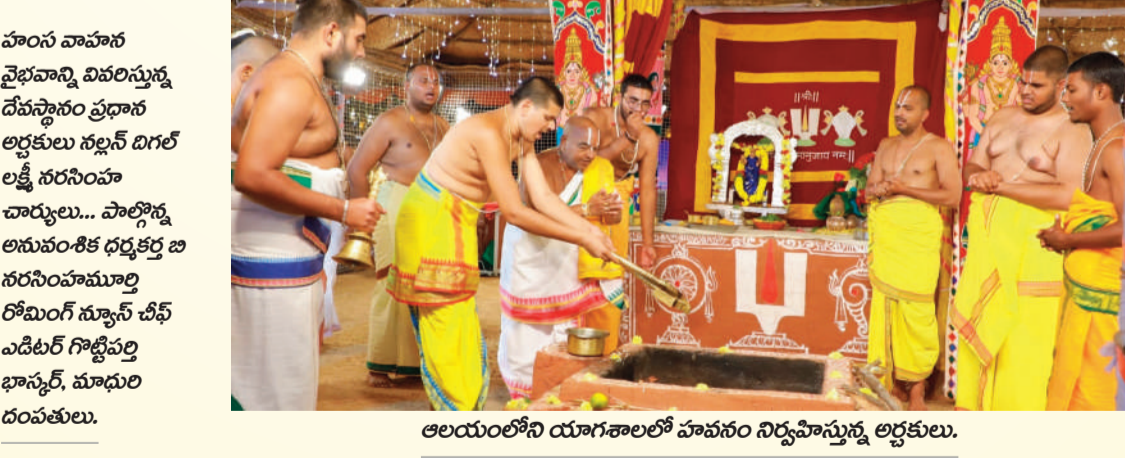
ఆలయంలోని యాగశాలలో హంసం నిర్వహిస్తున్న అర్చకులు.