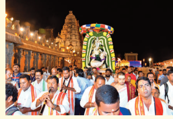
హంస వాహన తిరువీధి సేవ