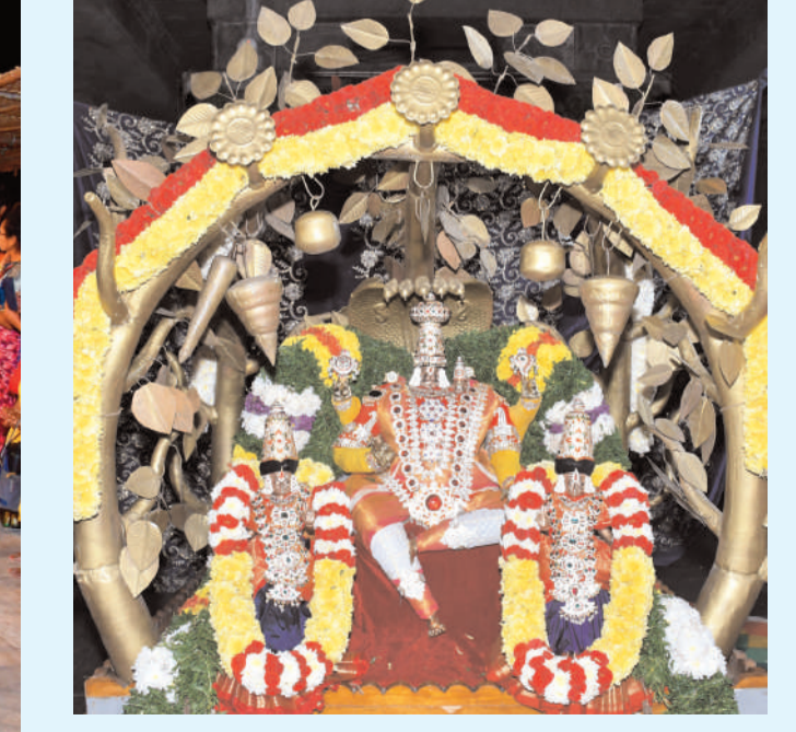
కల్పవృక్షంపై అభిష్ఠించిన శ్రీ లక్ష్మీనరసింహస్వామి వారు యాదాచలంలో తిరువీధి సేవలో భక్తులకు దర్శనం ఇచ్చారు.