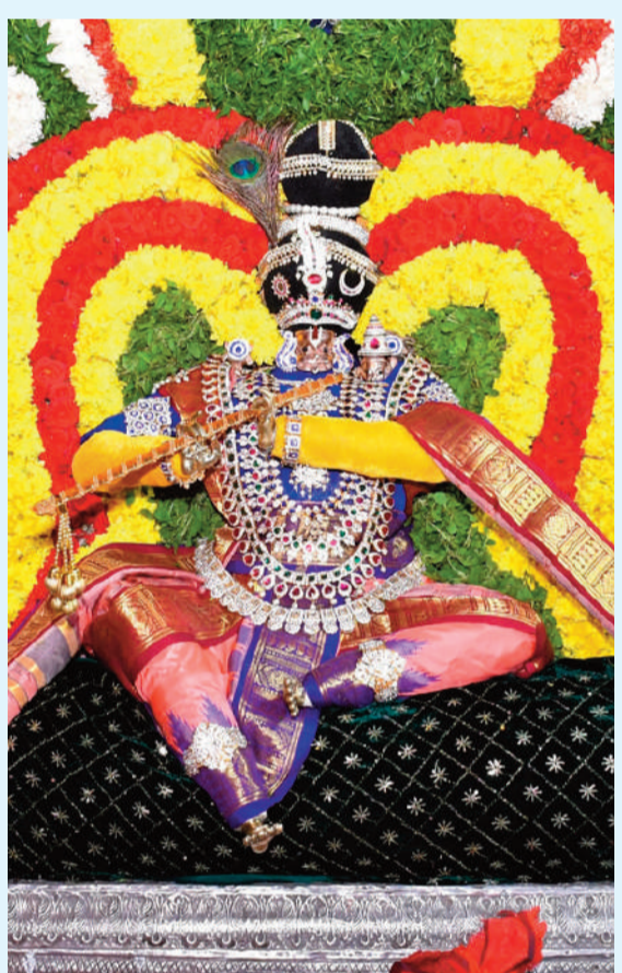
శ్రీకృష్ణుని అలంకారంలో శ్రీ లక్ష్మీనరసింహస్వామి వారు