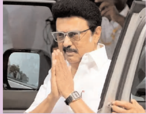
ప్రత్యేక పథకాలు, సత్వర వివక్ష సహాయ నిధి, కొత్త రైల్వే ప్రాజెక్టులను అందించాలి. రైల్వేకు అంతోపాదయ, టీజెఎస్, వందభారత్ వంటి పేర్లు పెట్టడం ఆపండి.

దానికి బదులు తమిళ పేర్లను పెట్టండి. తమిళ భాషపై ప్రేమను మాటల్లో కాకుండా.. చేతల్లో చూపించండి' అని స్టాలిన్ పేర్కొన్నారు. లోక్ సభ నియోజకవర్గాల పునర్విభజన అంశంపై జరిగిన అఖిలపక్ష సమావేశంలో స్టాలిన్ మాట్లాడారు. 1971 జనాభా లెక్కల ఆధారంగానే విభజన పక్రియ చేపట్టాలని ప్రధాని మోదీని స్టాలిన్ ఆభ్యర్థించారు. ప్రస్తుత జనాభా ప్రకారం.. పార్లమెంటులో తాము 12 సీట్లు కోల్పోయి.. 10 సీట్లు మాత్రమే వస్తాయని ఆందోళన వ్యక్తం చేశారు. ఇది తమిళ రాజకీయాలపై ప్రత్యక్షంగా దాడి చేయడమేనన్నారు. ఈ చర్య రాష్ట్ర గౌంతును నొక్కేస్తుందన్నారు. తాము విభజనకు వ్యతిరేకం కాదనీ.. కానీ, గత 50 ఏళ్లుగా సామాజిక, ఆర్థిక సంక్షేమ పథకాలను సమర్థవంతంగా అమలు చేసిన తమకు ఇది శిక్ష కాకూడదన్నారు. ఈ సందర్భంగా 2026 జనాభా లెక్కల ఆధారంగా విభజన పక్రియ చేపట్టరాదని అఖిలపక్ష సమావేశం డిమాండ్ చేసింది.