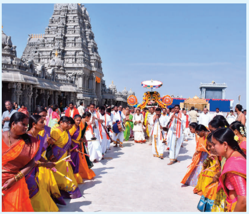
అలంకార సేవ ముందు కోలాట బృందం సభ్యులకు కోలాటాలు..