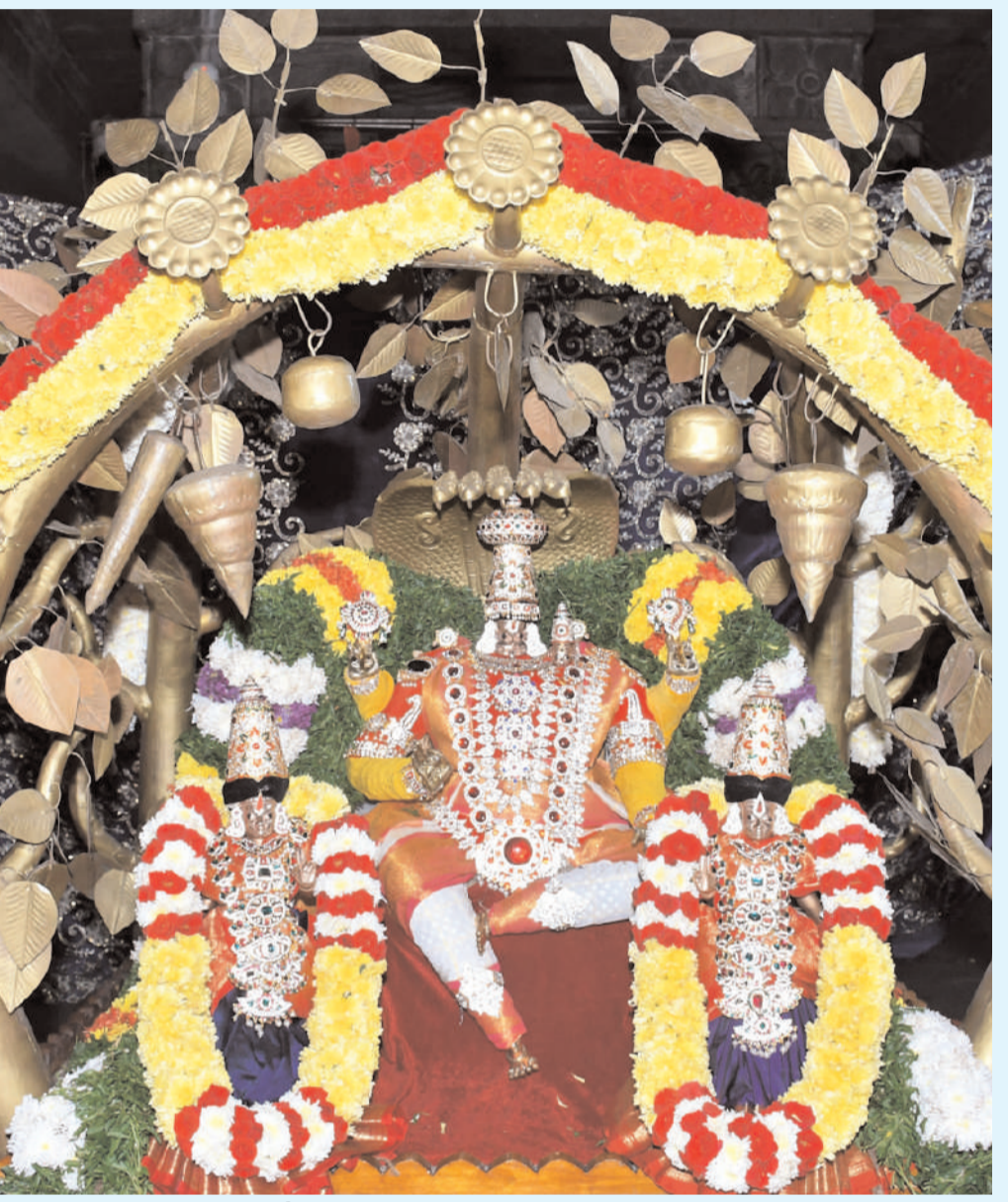
యాదగిరి కొండపై కల్పవృక్షం ధరించారు...ధరించారు!!

మాత్రమే పవిత్రతను చేకూర్చిందని, కానీ నారాయణుడి కృష్ణనామం, కృష్ణదర్శనం, కృష్ణస్మరణం నమస్త జీవితోటికి మోక్షాన్ని, ముక్తిని అందిస్తుందని అస్థాన పండితులు భక్తులకు వివరించారు. పాస్చాతానంపై విహారంపైన యాదగిరిశుడు యాదగిరిగుట్ట బ్రహ్మాత్మవాల్లో భాగంగా రాత్రి స్వామివారిని పాస్చాతానంపై విహారంపజేసి సుమదురు ఘట్టాన్ని అర్చకులు ఘనంగా నిర్వహించారు. పాస్చాతానంపై లక్ష్మీనమేతంగా ఆలీనులైన యాదగిరిశుడు.. రాత్రి 8:30 గంటలకు ప్రధానాలయ చూడవీధుల్లో ఊరేగుతూ భక్తులను కనువిందు చేశారు. ప్రధానాలయం చుట్టూ స్వామివారి పాస్చాతాన సేవను విహారంపజేసిన అనంతరం.. తూర్పు ద్వారం ఎదుట స్వామివారిని అభిష్ఠింపజేసి పాస్చాతాన సేవ విశిష్టతను అర్చకులు భక్తులకు ప్రవచించారు. భగవంతుడే కల్పవృక్ష స్వరూపమని.. అడిగినా అడగకున్నా నర్మలోకాలకు అవసరమైన మేర అనుగ్రహించే స్వరూపమే కల్పవృక్ష(పాస్చాతాన స్వరూపం) స్వరూపమని, పాస్చాతాన సేవ ద్వారా స్వామివారి లీలలను భక్తులకు ఉపదేశించారు. నేడు గోవర్ధనగిరిధారి, సింహవాహన సేవ బ్రహ్మాత్మవాల్లో భాగంగా గురువారం స్వామివారి గోవర్ధనగిరిధారి అలంకార సేవ, సింహవాహన సేవను నిర్వహించనున్నారు. ఉదయం 9 గంటలకు గోవర్ధనగిరిధారి అలంకారంలో స్వామివారిని ఊరేగించి, రాత్రి 8:30 గంటలకు సింహ వాహనంపై విహారంపజేయనున్నారు.