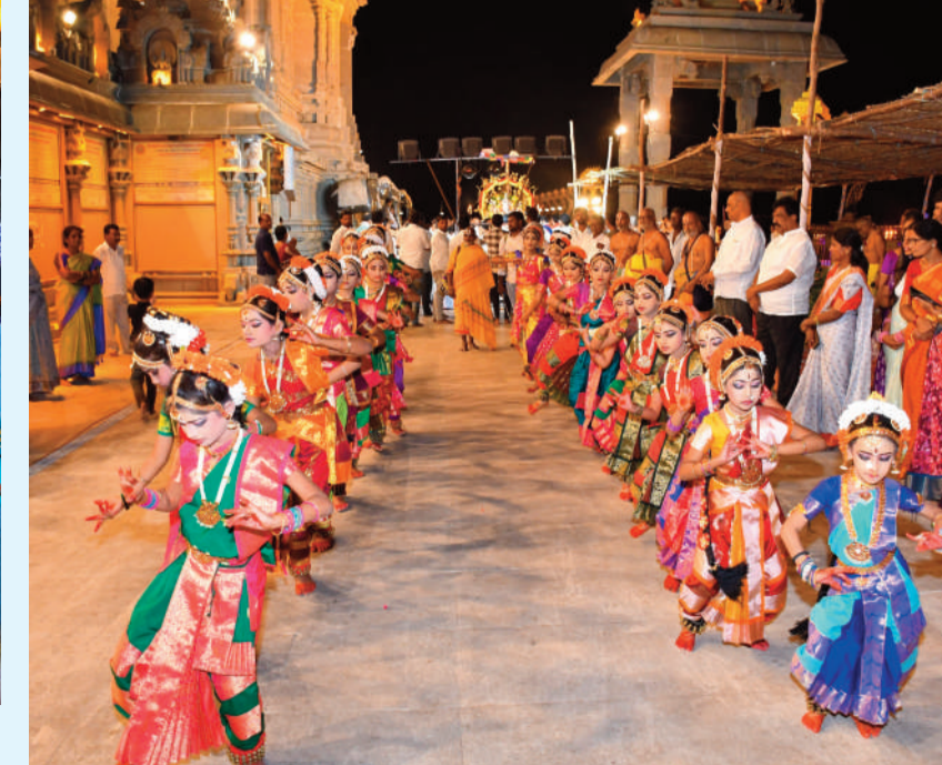
అలంకార సేవ ముందు ఆకట్టుకున్న కూచిపూడి నృత్యాలి.