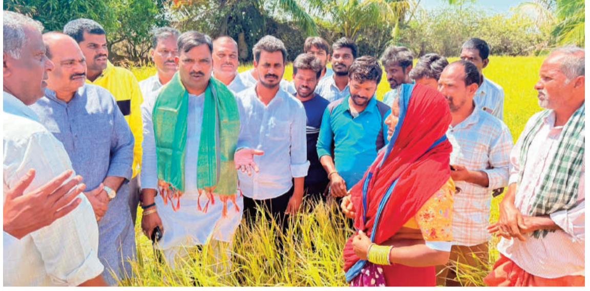
నష్టపోయిన పంటను అంచనా వేసి అధికారులు ప్రభుత్వానికి రిపోర్టు అందించాలని తెలిపారు. ప్రభుత్వం దృష్టికి తీసుకుని వెళ్లి నష్టపోయిన రైతులకు నష్టపరిహారాన్ని అందించే విధంగా చర్యలు తీసుకుంటామని తెలిపారు.

యాదగిరిగుట్ట, రోమింగ్ న్యూస్: అకాల వర్షానికి తుర్పుపల్లి మండలంలో అతలకుతులం అయిన వ్యవసాయ పంటలను,మామిడి తోటలను శుక్రవారం రోజు ఉదయం తెలంగాణ రాష్ట్ర ప్రభుత్వ విప్ అలీర్ ఎమ్మెల్యే శ్రీ బీర్ల అయిలయ్య గారు సందర్శించారు. ఈ అకాల వర్షం వల్ల వ్యవసాయ పంటలు దెబ్బతిన్నాయి,వడ్డు,మామిడితోటలో మామిడి కాయలు నెలరాలాయి, దీంతో ఆ రైతులను ఎమ్మెల్యే బీర్ల అయిలయ్య గారు ఓదార్చారు. వారి పంట పొలాలను మామిడి తోటలో కలయ తిరుగుతూ సందర్శించి ప్రభుత్వం వైపున, తాను అండగా ఉంటామని ధీమా అందించారు. ఈ సందర్భంగా ఎమ్మెల్యే బీర్ల అయిలయ్య గారు కలెక్టర్ హనుమంతరావు గారికి చరవాణి ద్వారా రైతుల ఆవేదన ను తెలిపారు.నష్టపోయిన వివరాలు సేకరించి, నష్టపరిహారం అందించాలని తెలిపారు. ఎమ్మెల్యే బీర్ల అయిలయ్య గారు మాట్లాడుతూ గురువారం కురిసిన వర్షాలకు తుర్పుపల్లి మండలంలో భారీగా నష్టము వాటిల్లినదని తెలిపారు.దయ్యం బండ ,తుర్పుపల్లి, మంచి రోని మామిళ్ళ గ్రామాల్లో,పంట పొలాలను,మామిడి తోటల్లో తీవ్ర నష్టం జరగటం బాధాకరమన్నారు.కలెక్టర్ గారికి,సంబంధించిన అధికారులు